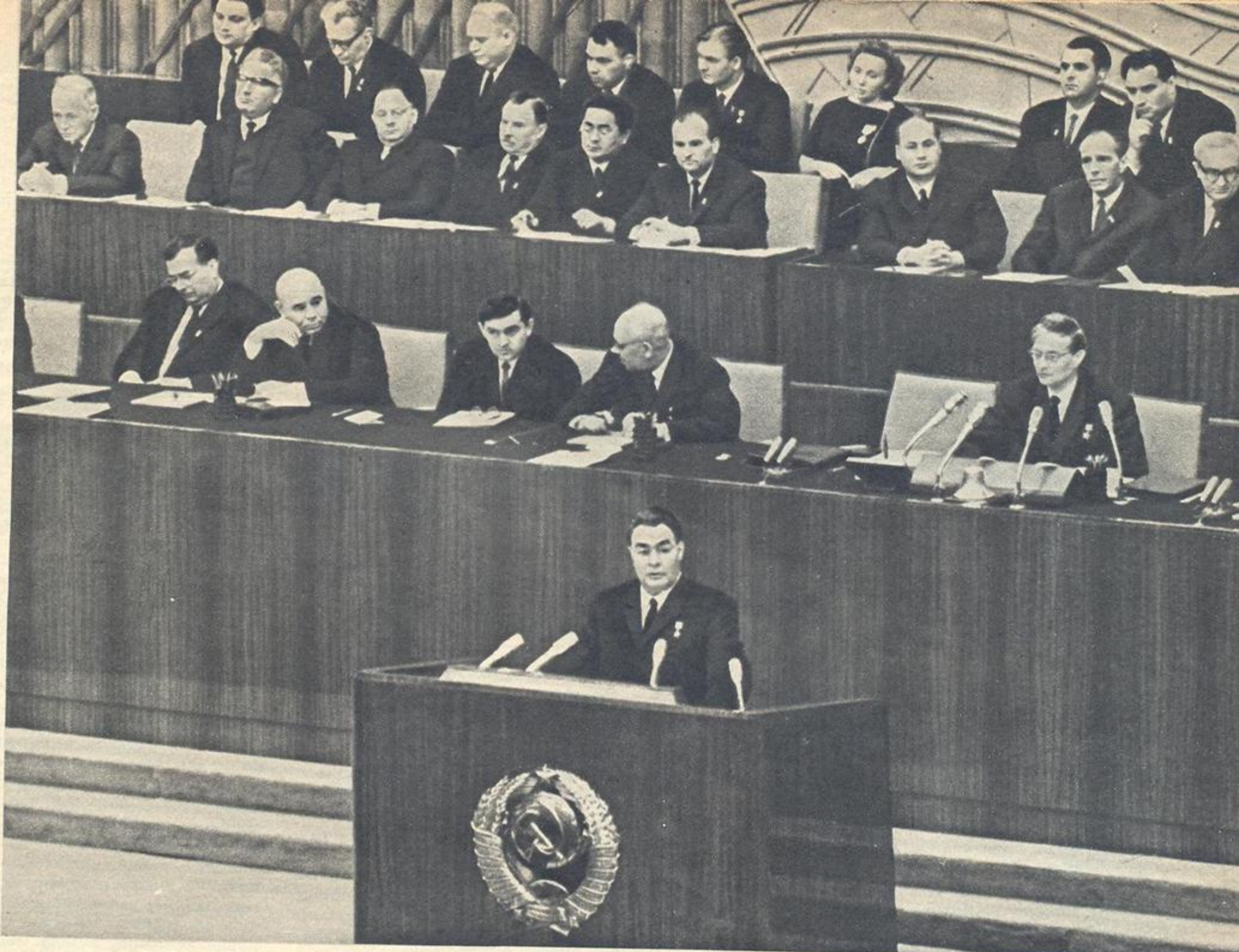
XXIII съезд КПСС. Первый секретарь Центрального Комитета партии Леонид Ильич Брежнев выступает с Отчетным докладом ЦК съезду.