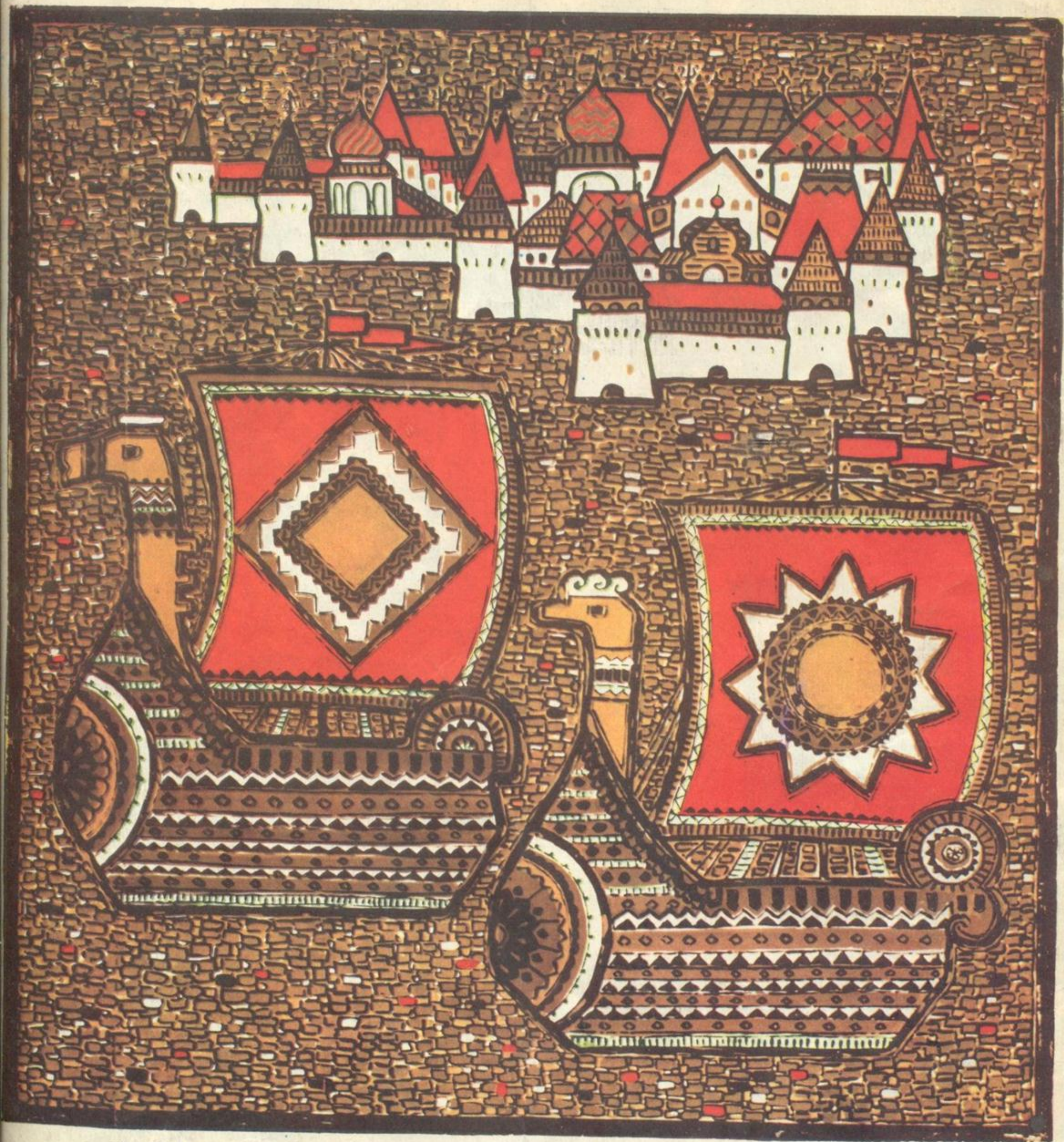
Н. АБРАМОВА. ЭСКИЗ ПЛАТКА.