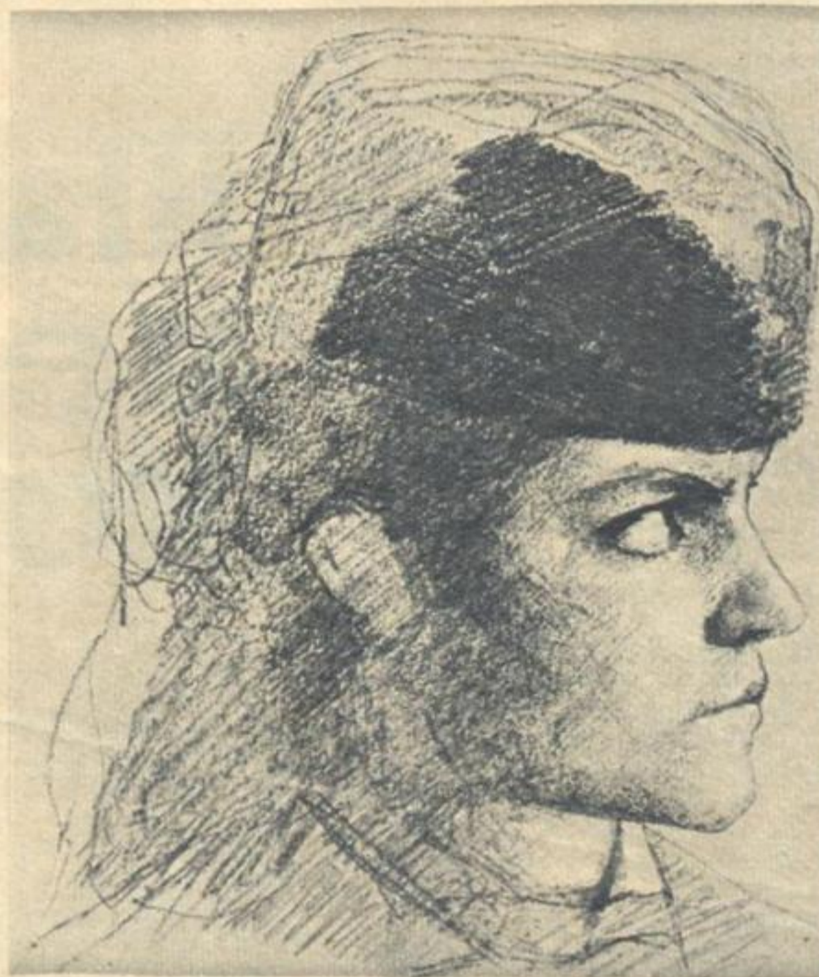
Женская голова. Этюд к картине «У Литовского замка».

Позднее художник создает несколько произведений, раскрывающих внутренний мир перedoвых русских женщин, Ярошенко пишет «Курсистку»