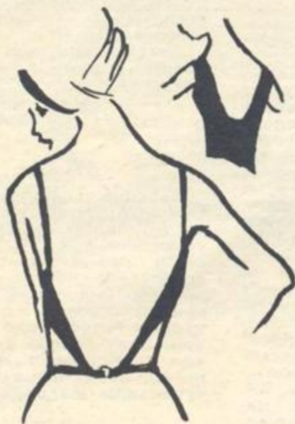
Этим летом будут снова модны открытые платья и сарафаны. Они

красивы, только очень неприятно, если в вырезе на спине видна застежка лифчика. Вы можете сами легко переделать один из своих лифчиков так, чтобы спина оставалась открытой. Отрежьте у лифчика спинку, оставив лишь по несколько сантиметров от боковых швов. К каждому из отрезанных концов пришейте резинку, излишек материи на спинке заложите вовнутрь и застрочите (см. рисунок). Обе резинки пришейте к узенькому пояску или тесьме, равной окружности талии, и сделайте застежку. Осталось прикрепить плечики (место для них найдете при примерке) — и лифчик готов. Сделайте его заранее, чтобы жаркие дни не застали вас врасплох.