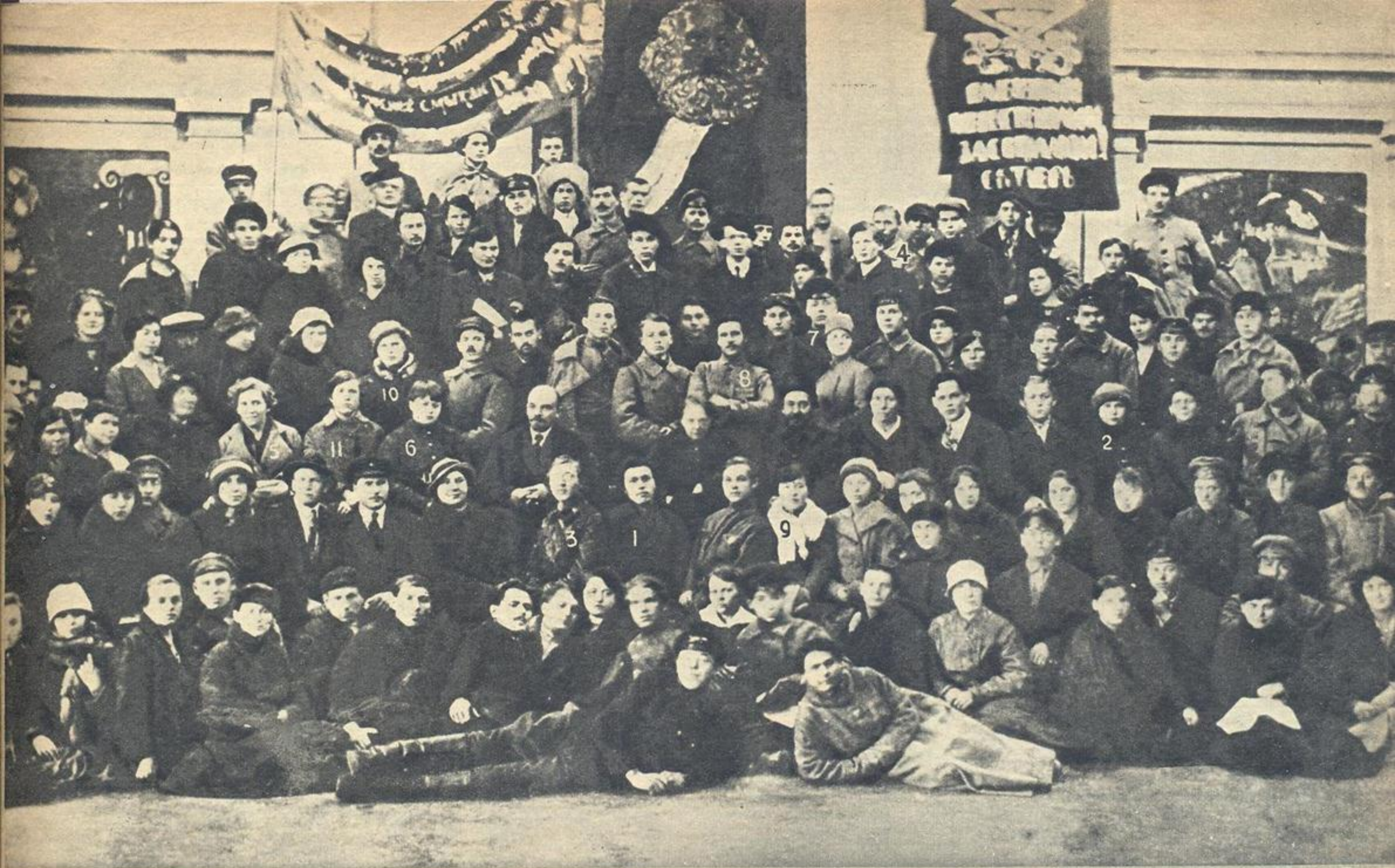
В. И. Ленин и Н. К. Крупская среди учащихся курсов по внешкольному образованию. 1919 год.