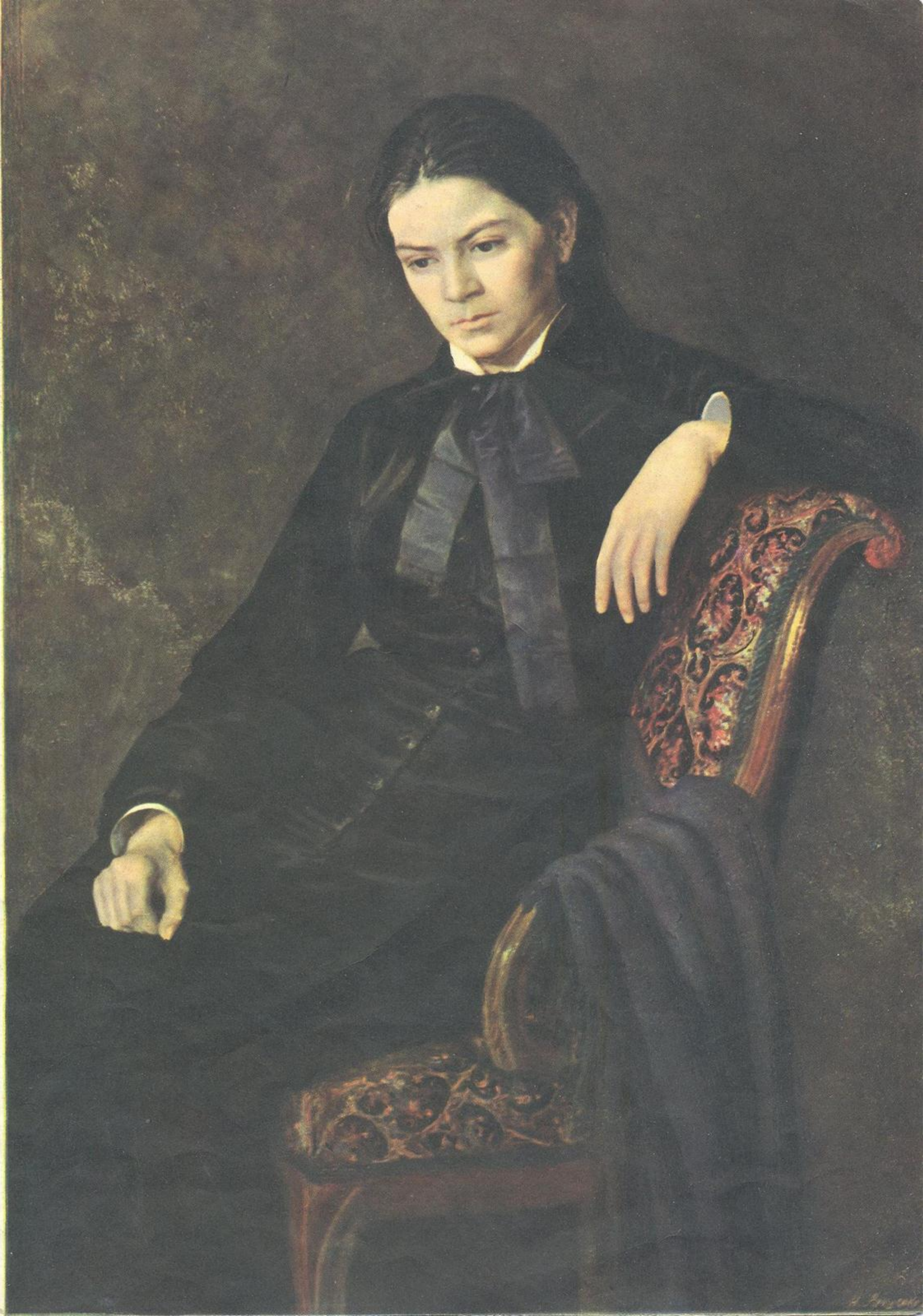
А. ЯРОШЕНКО. ПОРТРЕТ НЕИЗВЕСТНОЙ.