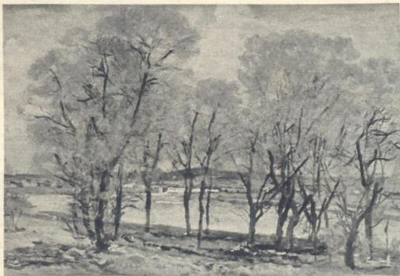
С. Герасимов. Весенний день.

Плакучие березы У пенистой реки, Когда же вы наденете Зеленые платки? Вам боязно И холодно От яростной волны, До пояса, До пояса В воде стоите вы. Ночами звезды падают, Качаются у ног, А месяц побледневший До косточек Продрог.