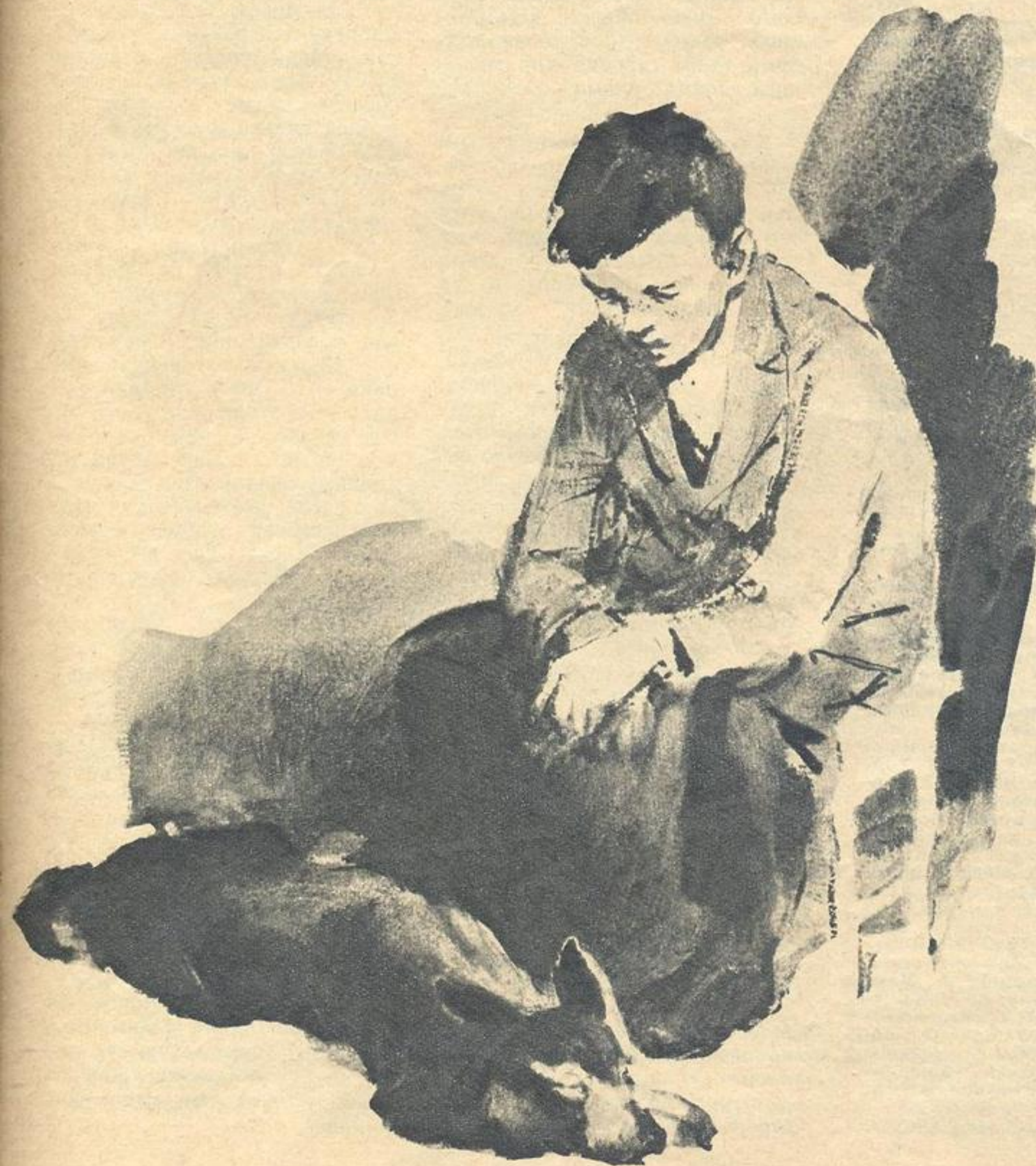
Рисунок И. УШАКОВА.

Выходит, что нужно и вам не глазами шарить по белу свету в поисках будущей профессии, а в себя заглянуть, себя спросить: что я люблю, что не устаю делать? И если кто-то вам скажет: «Это несерьезно», — не верьте, а проверьте, чтобы убедиться, что для вас серьезно, а что случайно.