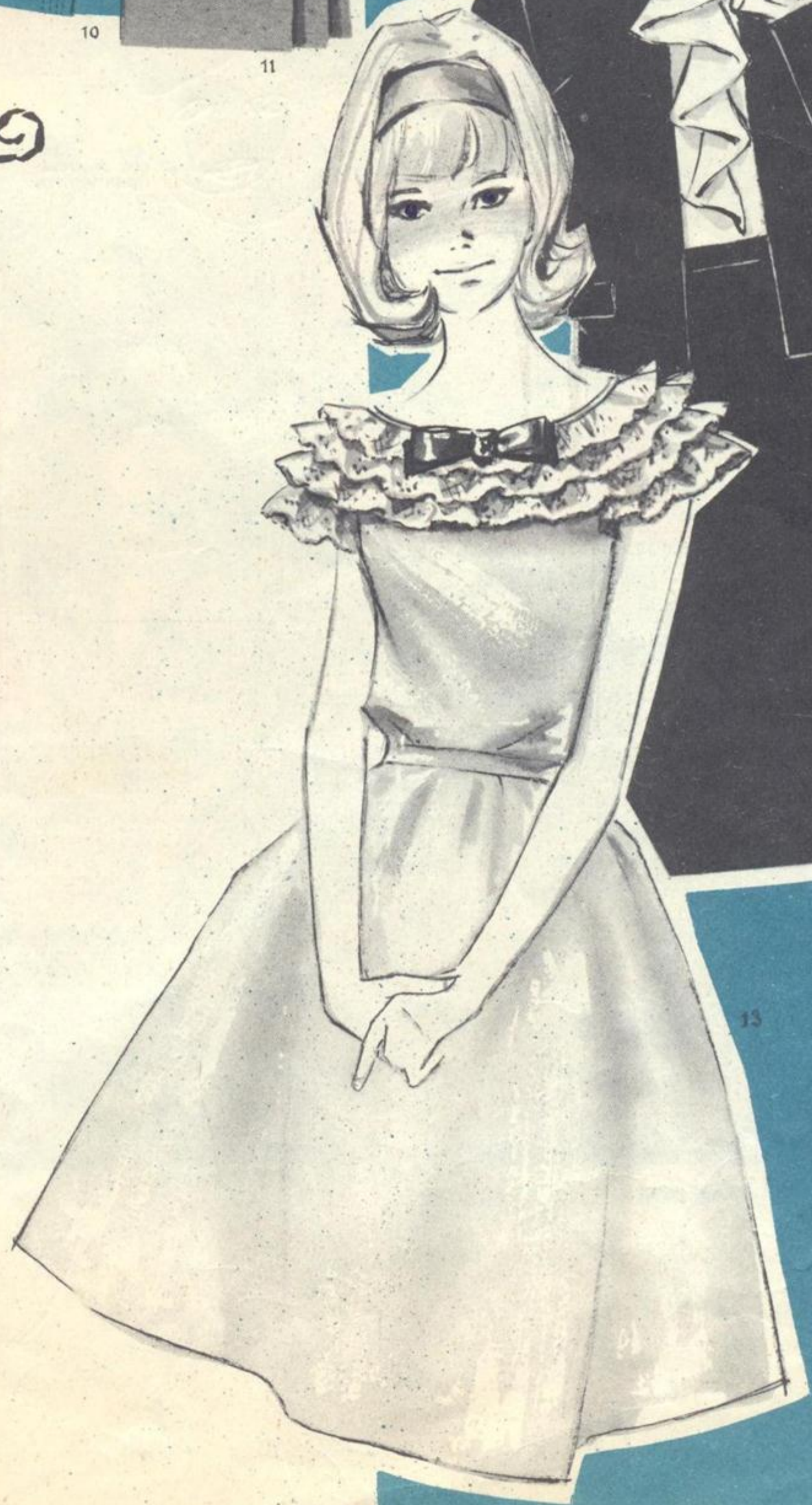
Рисунки Н. ГОЛИКОВОЙ