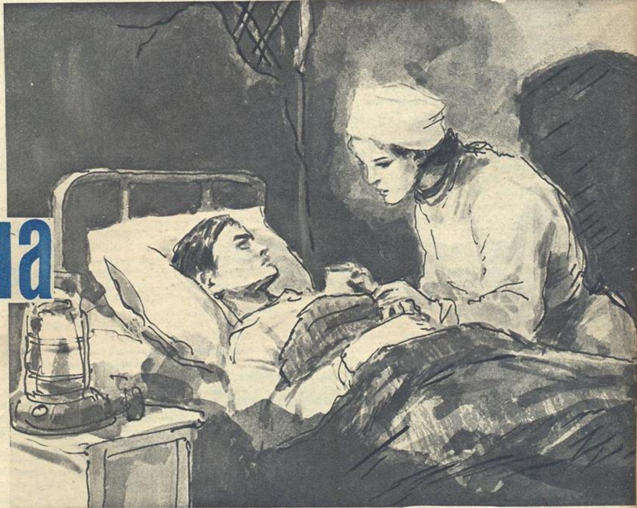
Рисунок В. ВЫСОЦКОГО.

на парту и опершись на правую, внимательно слушает историка. Впрочем, слушает ли?.. В семнадцать лет мы чертовски здорово умеем делать вид прилежно слушающих урок, натренированно готовы повторить слова педагога, витая в это время в ином, далеком от древней истории, радужном мире юности!.. А может быть, и слушает. Серые глаза его от внимания чуть расширены, темные брови приподняты. Очень широкие и густые, они, пожалуй, самое заметное в его округлом, простом лице, с беспечно-румяными щеками и типично российским курносом.